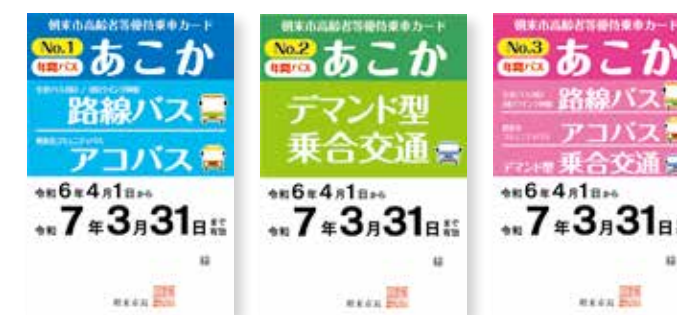
朝来市高齢者等優待乗車カード「あこか」 年間パス / 1ヶ月券

条件に該当する方には高齢者等優待乗車カード「あこか」や、どなたでもお買い求め可能な回数券をご用意しております。