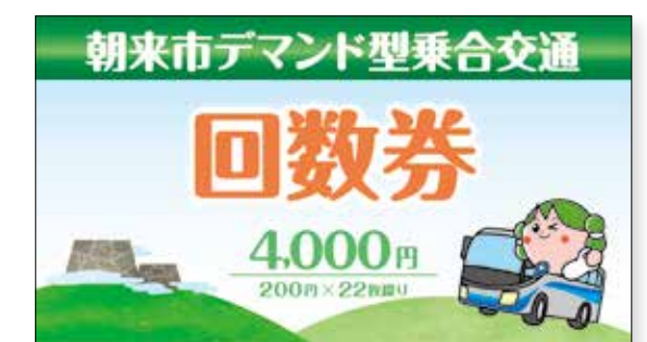
朝来市デマンド型乗合交通 回数券 200円×22枚綴り / 有効期限なし 4,000円